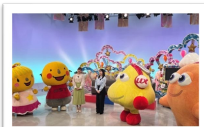
UXのゆうちゃん・ゴーちゃんがNSTへ