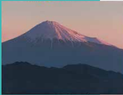
羽田裕《黎明富士》2019年 油彩