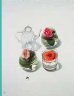
五味文彦《あかいはな》2010年 油彩