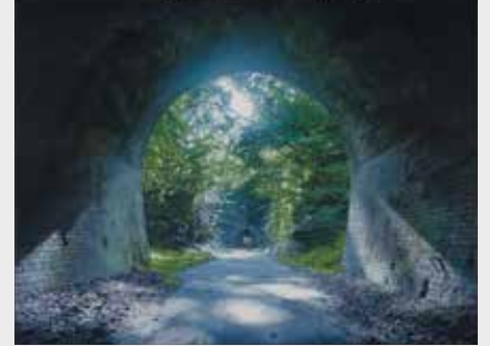
岩下慎吾《光をあつめて》2019年 油彩