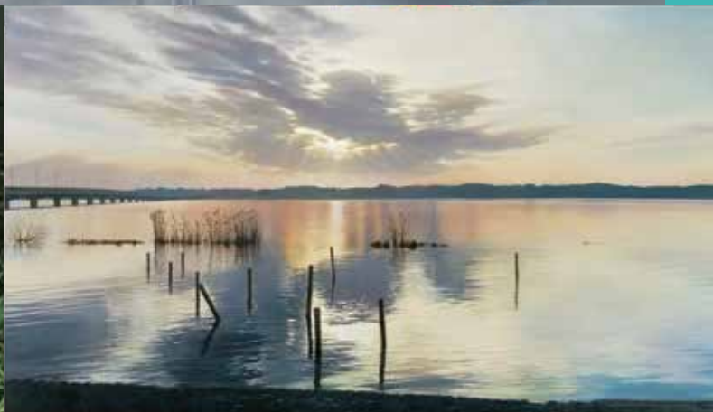
大畑稔浩《仰光一霞ヶ浦》2008年 油彩