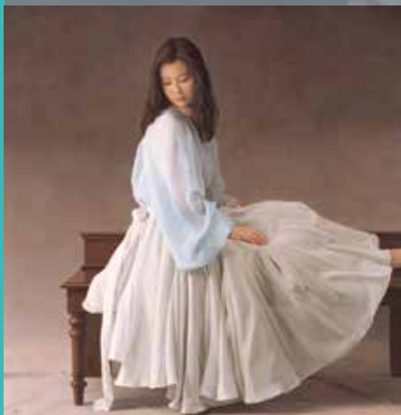
森本草介《未来》2011年 油彩