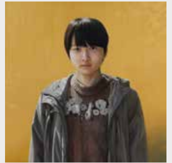
中西優多朗《次の音》2019年 油彩