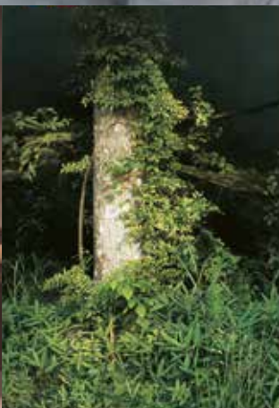
五味文彦《木霊の囁き》2010年 油彩