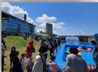
信濃川感謝祭 (NST本社)