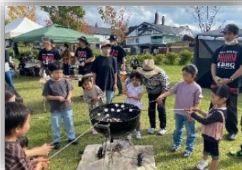
NSTアカデミーデイキャンプ2022