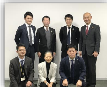
NST開局55周年実行委員会メンバー